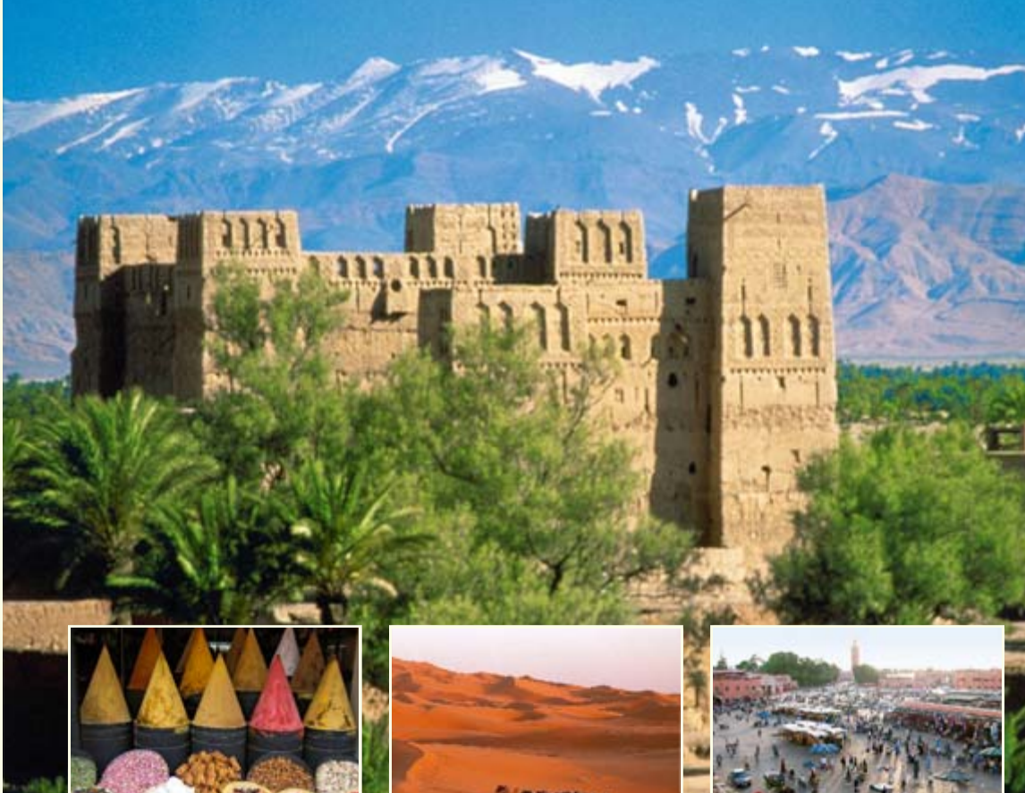
Kasbah de Skoura mit dem Atlas-Gebirge im Hintergrund